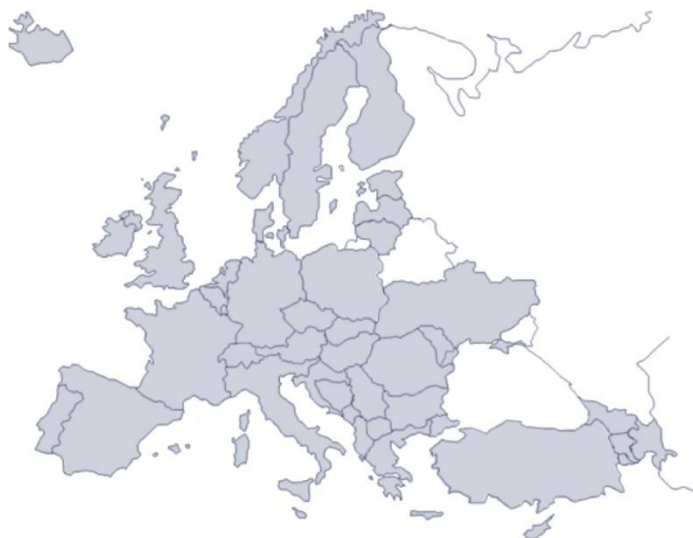
Stati aderenti all'ECAC